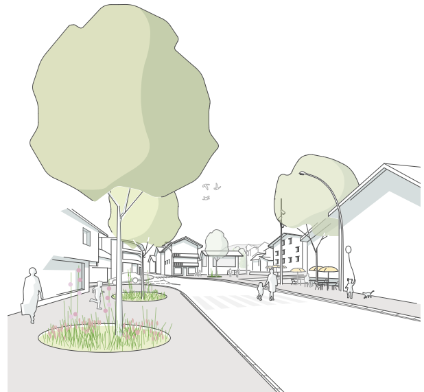
aménagements de rue | projet traversée Savièse

Il s'agit ici de s'appuyer sur le réseau de chemins pédestres existant en le connectant à la route cantonale, en le rendant lisible et en complétant les parties manquantes. Concrètement, l'espace public se dilate par le biais de trottoir traversant donnant priorité aux piéton-ne-s face à la voiture. Offrir de bonnes conditions aux usager-ère-s les encourage à la marche et favorise leur bien-être. La rue est alors parourue et vivante.