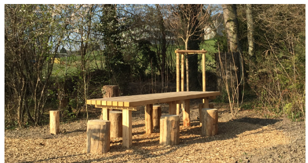
Cheminement en copeaux et mobilier en bois | projet du Bois de la Citadelle

Les aménagements paysagers ont été réalisés de manière à être en adéquation avec le lieu, soit d'utiliser le minimum de béton possible mais surtout en valorisant le bois en provenance directe du site. L'entretien et la coupe forestière effectués en amont ont permis les fondements des différentes réalisations paysagères, soit principalement un cheminement en copeaux et du mobilier. D'un côté, le parcours est sinueux pour s'intégrer et souligner le biotope dans lequel il s'installe. De l'autre côté, le mobilier est pensé de façon à avoir le moindre impact, soit en étant conçu sur la base d'emboîtement de pièces plutôt que par la nécessité d'utiliser du métal pour les assembler.