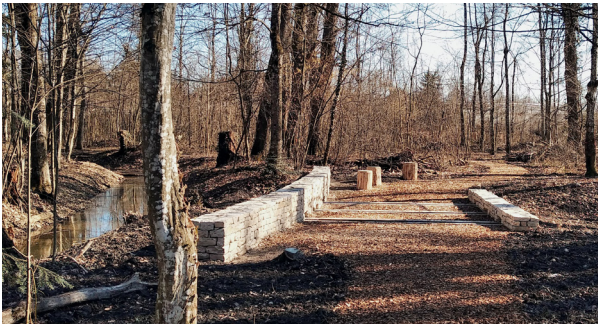
aménagements et fossé à ciel ouvert | projet du Bois de la Citadelle

Les projets d'architecture du paysage, ont pour ambition de créer des espaces à la fois fonctionnels, soit d'aménager des espaces extérieurs pour la population, mais ils cherchent aussi à revaloriser le lieu en question et surtout à trouver une symbiose avec le milieu dans lequel ils se situent. Cette volonté de créer des espaces en synergie avec leur environnement est au cœur des projets que nous élaborons. D'une part, nous cherchons à enrichir l'environnement sur lequel nous travaillons et d'autre part à avoir le moindre impact sur le milieu. Plus précisément, nous aspirons à créer des projets qui se fondent dans le site sur lequel ils se déploient.